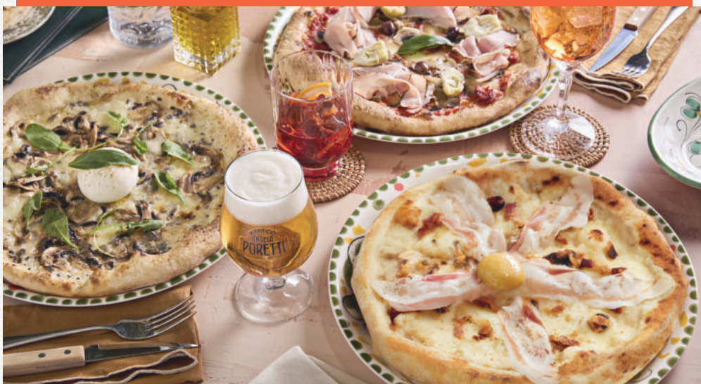
Carbonara / Al tartufo / Capricciosa

COMME À NAPLES ET AFIN DE PRÉSERVER LA QUALITÉ DE NOS PRODUITS. TOUTES NOS CHARCUTERIES ET FROMAGES (TYPE STRACCIATELLA, BURRATINA) SONT AJOUTÉS APRÈS CUISSON.