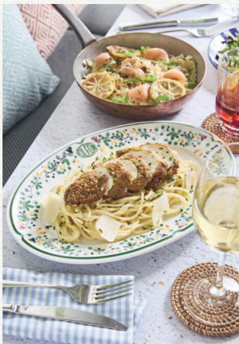
Spaghetti Alfredo / Mafaldine salmone

Burratina, poêlée de pleurotes et champignons, sauce crémeuse au Parmesan