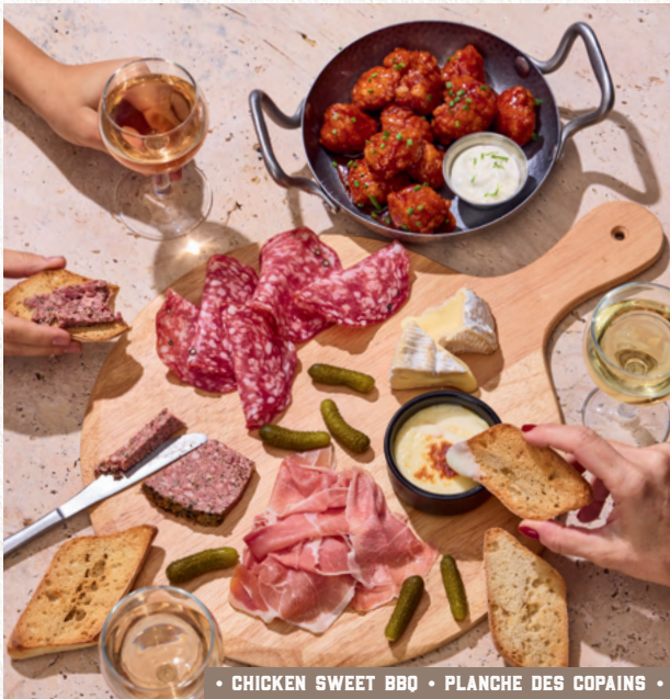
• CHICKEN SWEET BBO • PLANCHE DES COPAINS •

Bouchées de poulet pané enrobées d'une sauce sweet BBQ, sauce crémeuse citron vert