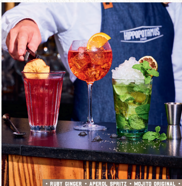
• RUBY GINGER • APEROL SPRITZ • MOJITO ORIGINAL •

Vodka Eristoff, crème de pêche de vigne, jus d'orange (1) , boisson au cranberry