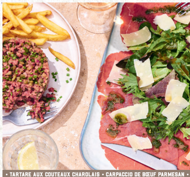
• TARTARE AUX COUTEAUX CHAROLAIS • CARPACCIO DE BŒUF PARMESAN •

Fines tranches de bœuf, parmesan AOP, salade mélangée, sauce pesto vert