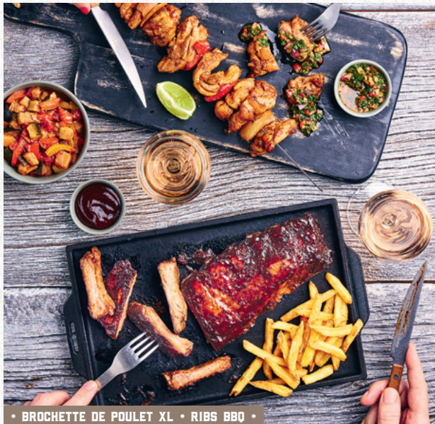
• BROCHETTE DE POULET XL • RIBS BBQ •

🔥 RIBS BBQ ..... 19€90 Travers de porc marinés, sauce BBQ, frites