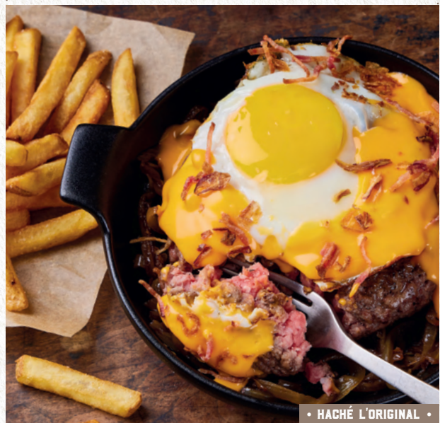
• HACHÉ L'ORIGINAL •

Steak haché XL (1) façon bouchère ◀ ▶, œuf au plat plein air, sauce cheddar, oignons confits, bacon grillé, oignons crispy