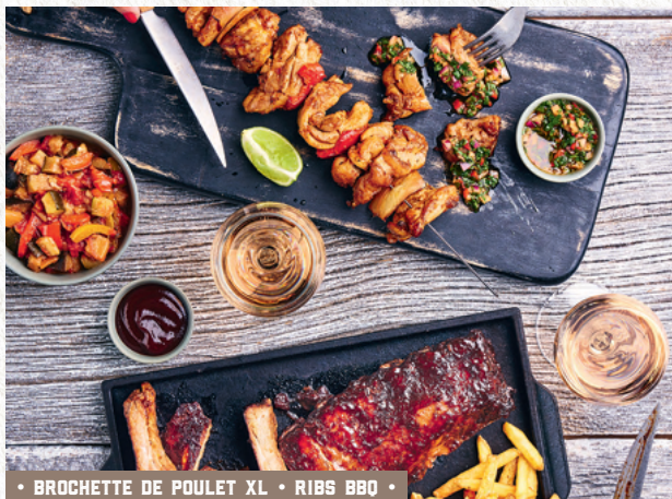
• BROCHETTE DE POULET XL • RIBS BBQ •

Cheddar fondu à la bière, jambon blanc, pain de campagne, œuf au plat, frites