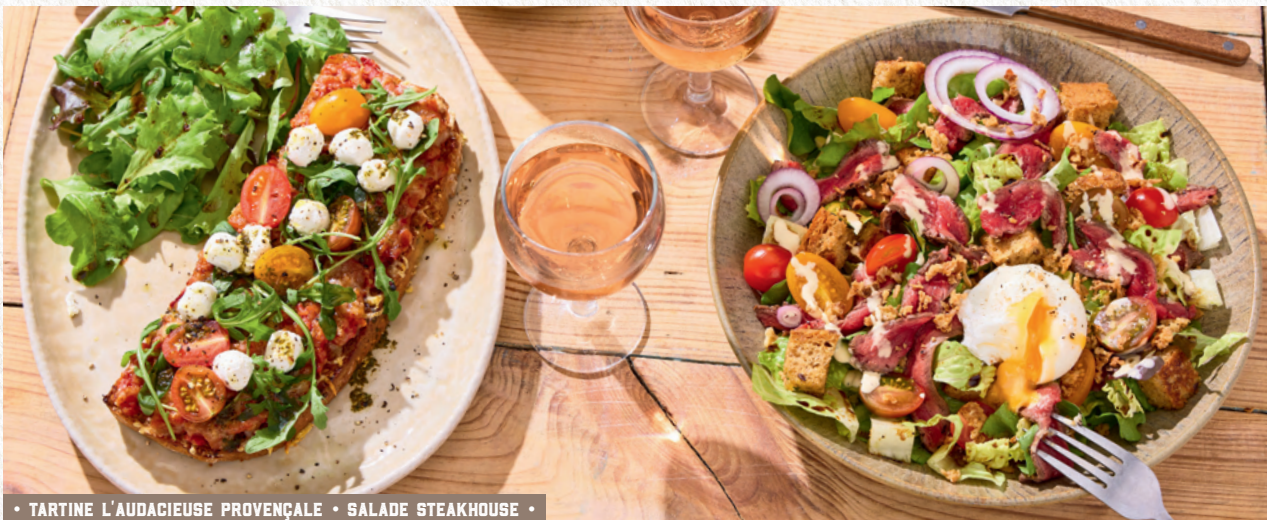
• TARTINE L'AUDACIEUSE PROVENÇALE • SALADE STEAKHOUSE •

Aiguillettes de poulet croustillantes, parmesan AOP, salade romaine, tomates, croûtons, sauce caesar