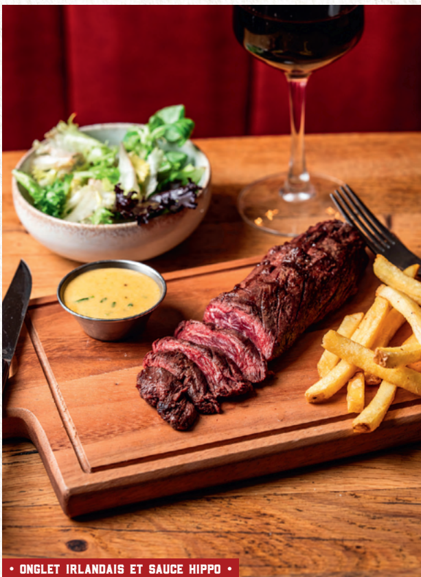
• ONGLET IRLANDAIS ET SAUCE HIPPO •