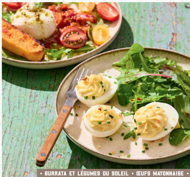
• BURRATA ET LÉGUMES DU SOLEIL • ŒUFS MAYONNAISE •