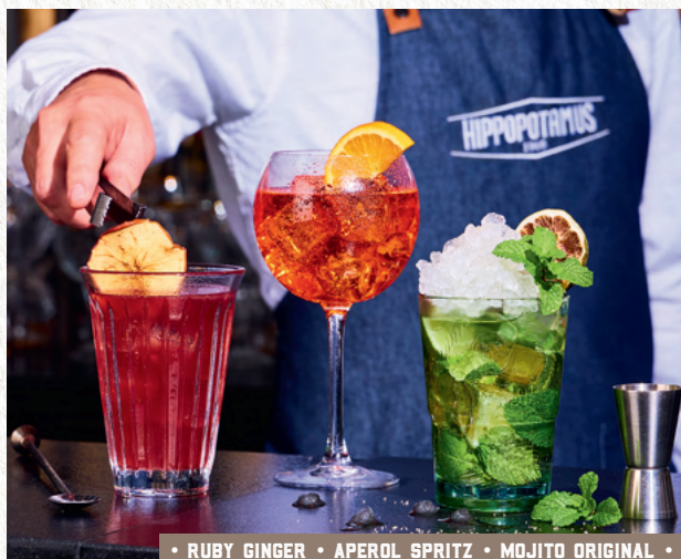
• RUBY GINGER • APEROL SPRITZ • MOJITO ORIGINAL •

Vodka Eristoff, crème de pêche de vigne, jus d'orange (1) , boisson au cranberry