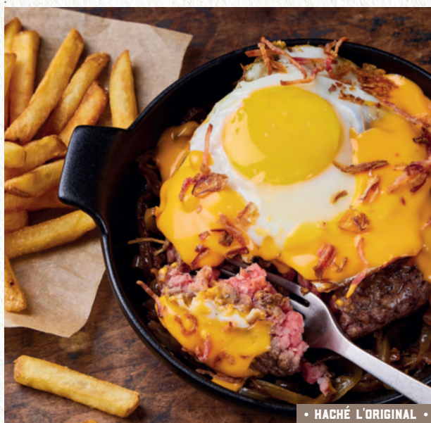
• HACHÉ L'ORIGINAL •

Steak haché XL (1) façon bouchère ◀ ▶, œuf au plat plein air, sauce cheddar, oignons confits, bacon grillé, oignons crispy