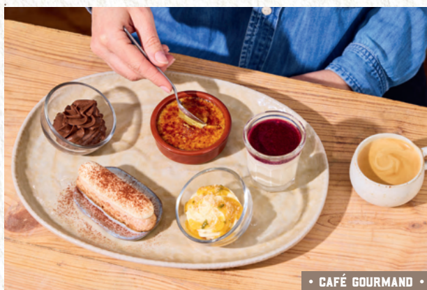
• CAFÉ GOURMAND •