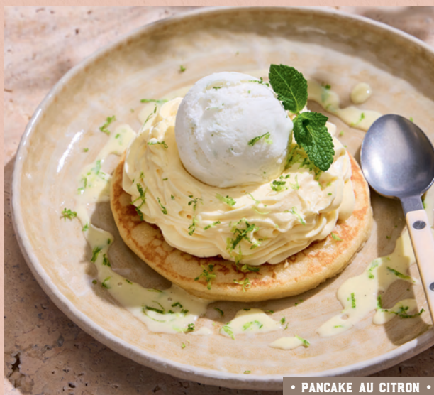
• PANCAKE AU CITRON •