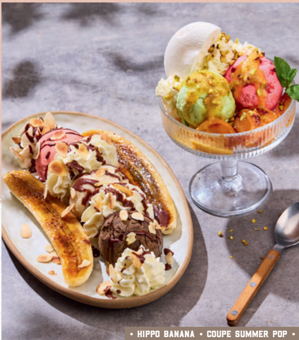
• HIPPO BANANA • COUPE SUMMER POP •