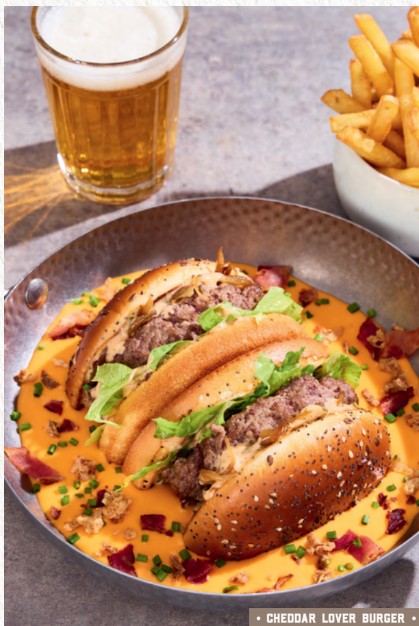
• CHEDDAR LOVER BURGER •

Tous nos burgers sont disponibles en version veggie (2)