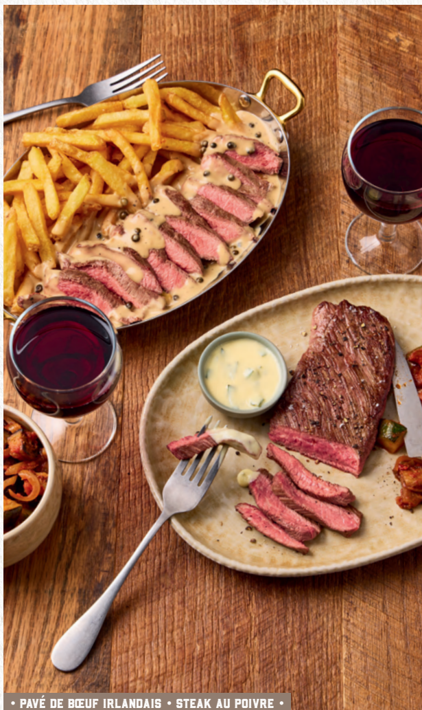
• PAVÉ DE BŒUF IRLANDAIS • STEAK AU POIVRE •

HIPPOPOTAMUS SOUTIEN LES ÉLEVEURS ET LE SAVOIR-FAIRE FRANÇAIS !