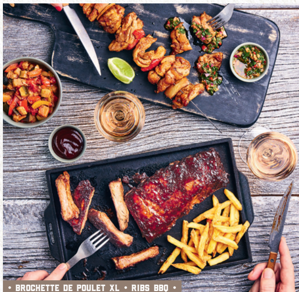
• BROCHETTE DE POULET XL • RIBS BBQ •

Travers de porc marinés, sauce BBQ, frites