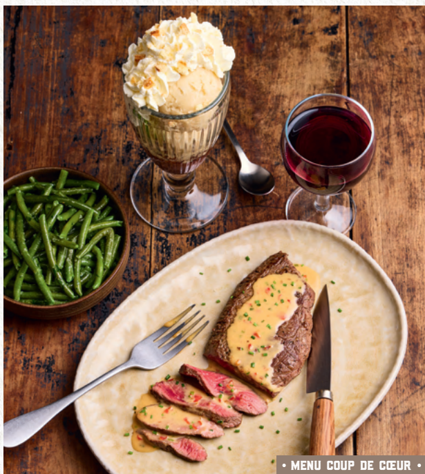
• MENU COUP DE CŒUR •

IGP Pays d'Oc - Cabernet Sauvignon (ROUGE) 25 cl ou IGP Pays - d'Oc Chardonnay (BLANC) 25 cl ou IGP du Gard - Grenache et Syrah (ROSÉ) 25 cl