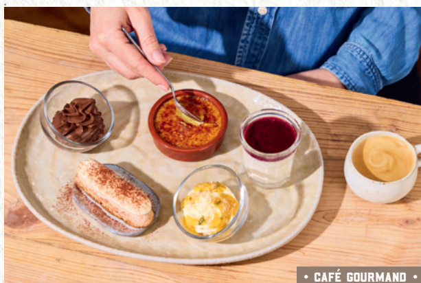
• CAFÉ GOURMAND •