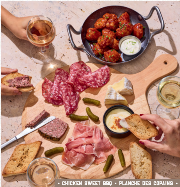
• CHICKEN SWEET BBO • PLANCHE DES COPAINS •

Bouchées de poulet pané enrobées d'une sauce sweet BBQ, sauce crémeuse citron vert