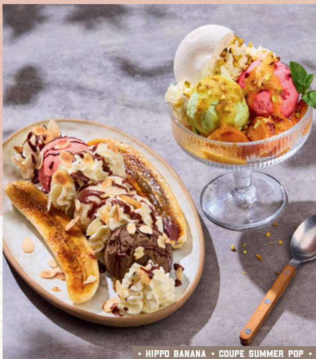
• HIPPO BANANA • COUPE SUMMER POP •