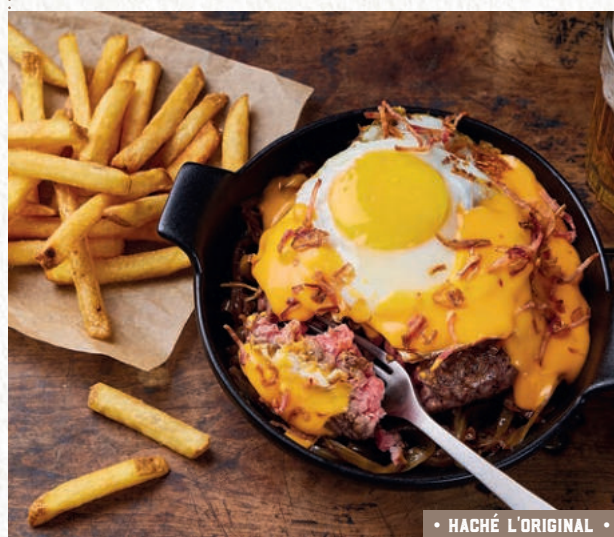
• HACHÉ L'ORIGINAL •

HACHÉ MONTAGNARD ..... 21€90 Steak haché XL (1) façon bouchère ◀ ▶, fromage à raclette fumée, galette de pommes de terre, bacon grillé, sauce mayonnaise à l'ail noir, crémeux de comté**, oignons crispy, oignons confits