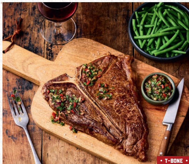
• T-BONE •

🔥 : cuisson braise. ◀ ▶ : viande 100 % française. AOP : Appellation d'Origine Protégée.