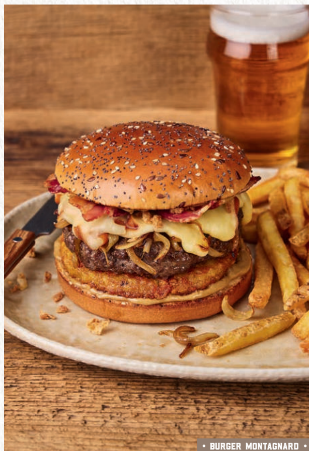
• BURGER MONTAGNARD •

Remplacez la viande de votre burger par notre haché végétal