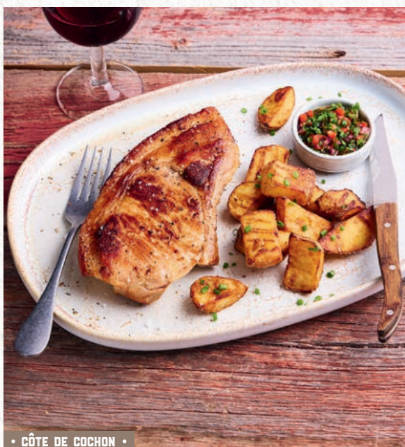
• CÔTE DE COCHON •

🔥 CÔTE DE COCHON ENV. 350 G ◀ ▶ ..... 16€90 Pommes de terre sautées, sauce au choix