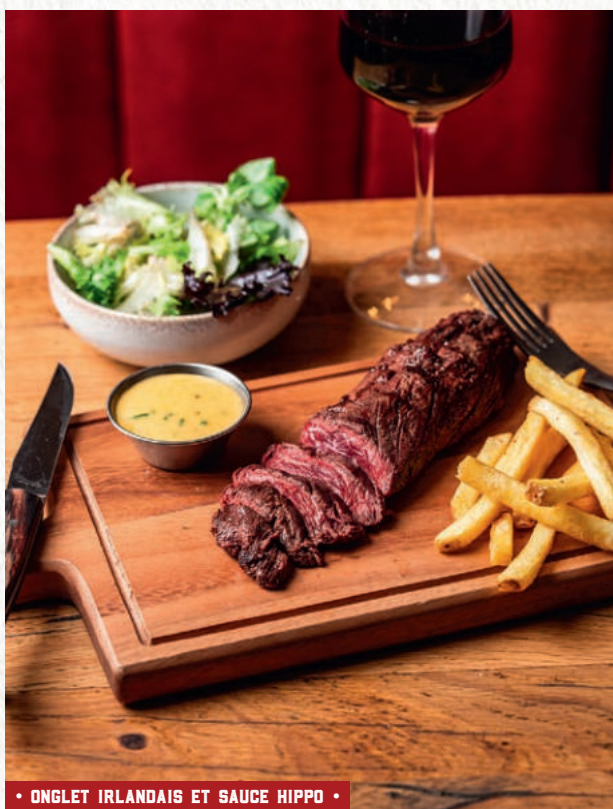
• ONGLET IRLANDAIS ET SAUCE HIPPO •