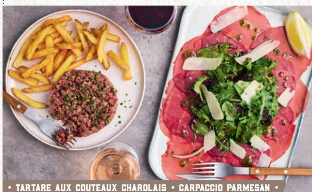
• TARTARE AUX COUTEAUX CHAROLAIS • CARPACCIO PARMESAN •

Fines tranches de bœuf, parmesan AOP, salade mélangée, pesto