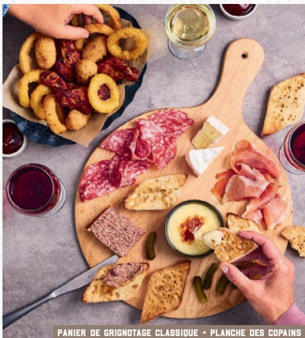
PANIER DE GRIGNOTAGE CLASSIQUE • PLANCHE DES COPAINS