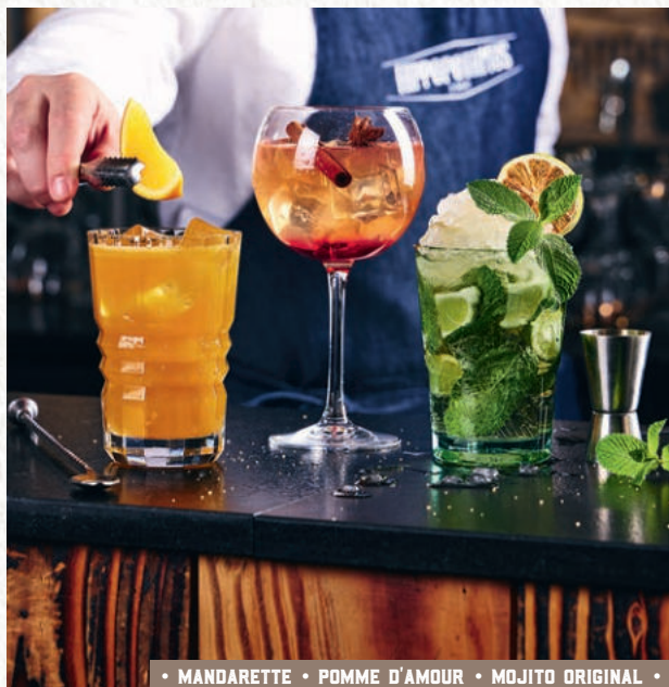
• MANDARETTE • POMME D'AMOUR • MOJITO ORIGINAL •

Vodka Eristoff, crème de pêche de vigne, jus d'orange (1) , boisson au cranberry