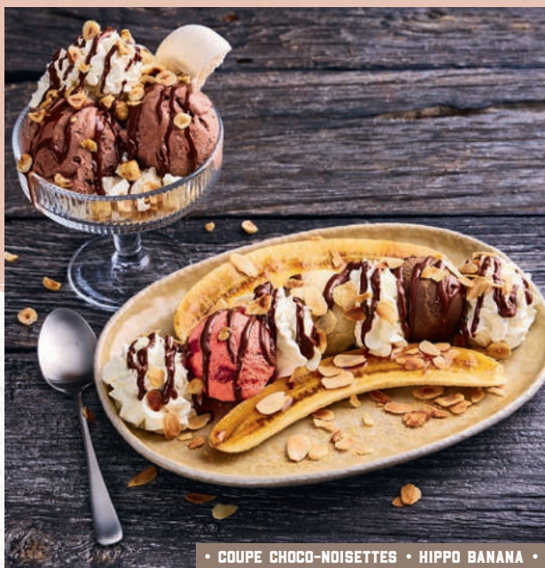
• COUPE CHOCO-NOISETTES • HIPPO BANANA •