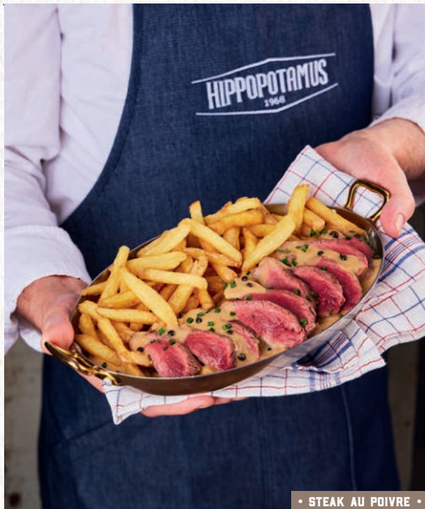
• STEAK AU POIVRE •

Pièce tendre avec un persillé qui révèle toutes ses saveurs