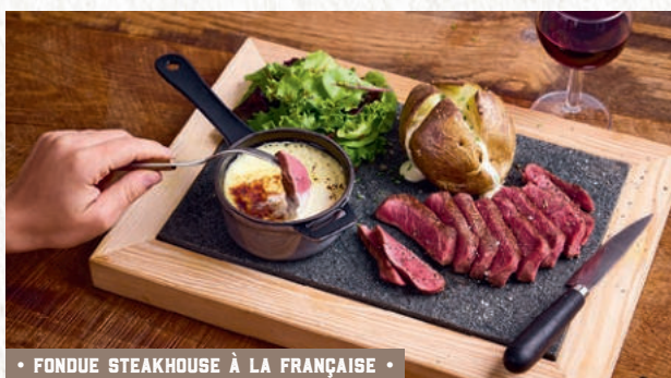
• FONDUE STEAKHOUSE À LA FRANÇAISE •