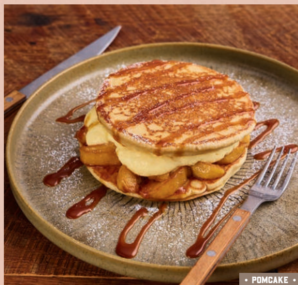
• POMCAKE •