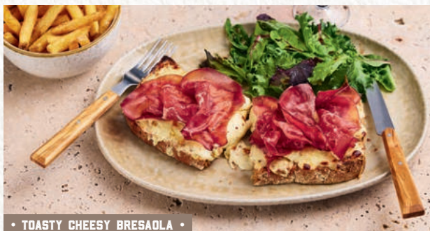
TOASTY CHEESY BRESAOLA

Pain de campagne aux graines, béchamel aux 3 fromages (4) et moutarde à l'ancienne, gratiné au comté, bresaola. Servie avec une salade mélangée et des frites