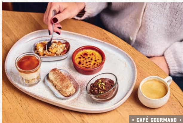
• CAFÉ GOURMAND •